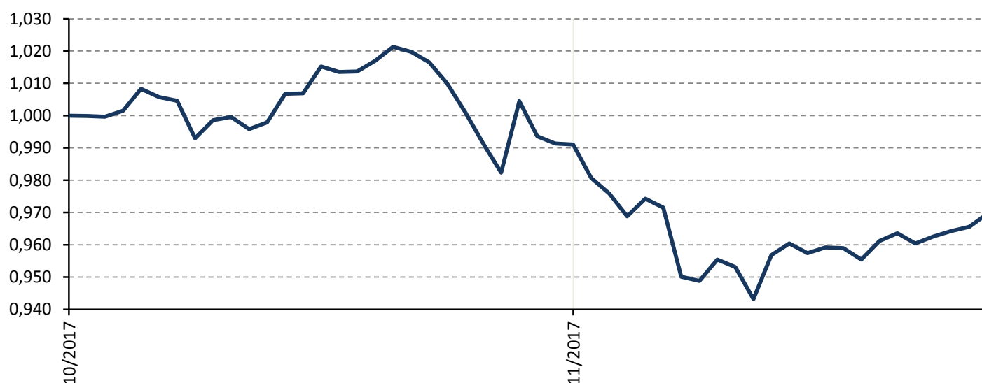
Vývoj hodnoty podílového listu fondu

Vyhlídky pro rok 2018 dle našeho názoru nahrávají spíše rizikovým aktivům (akcie, komodity apod.), jimž by mělo být podporou pokračující makroekonomické oživení a růst zisků firem. Na ceny dluhopisů by měla nadále tlačit především očekávaná normalizace (zvyšování) úrokových sazeb.